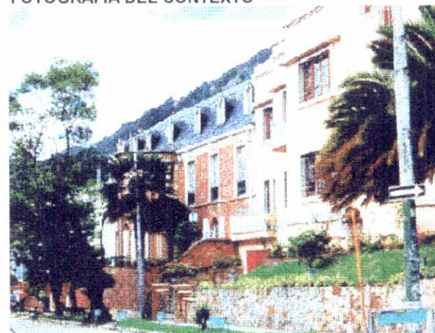
ALTERACIONES A LA EDIFICACION ORIGINAL VISIBLES DESDE EL EXTERIOR :